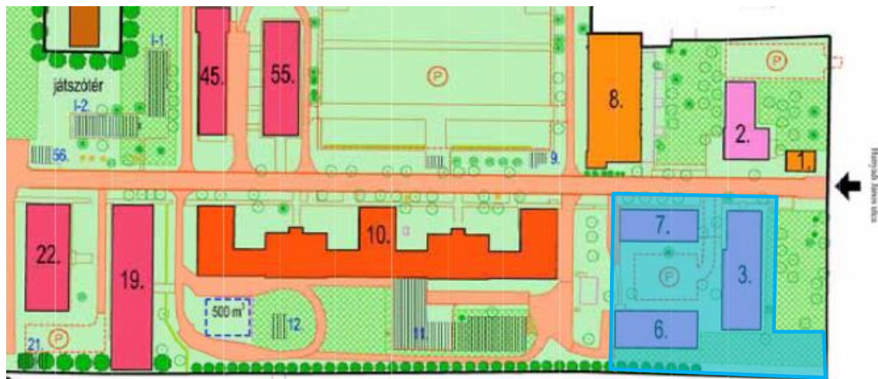
1. Ábra: Épületek számozás