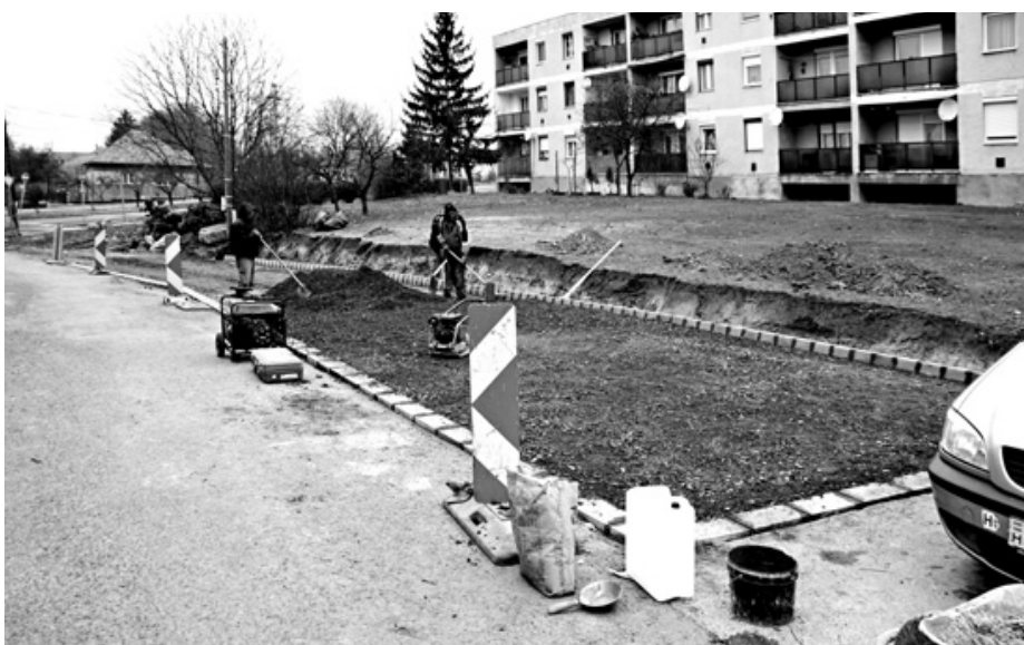
Parkoló bővítés a Nyárfa utcában