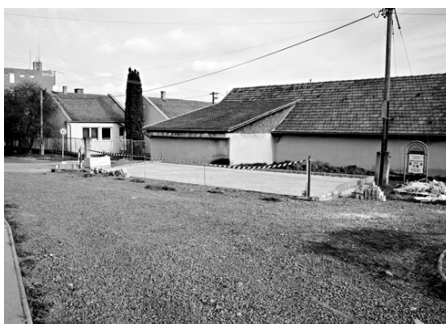
Új parkoló a napközi-étkező udvarban