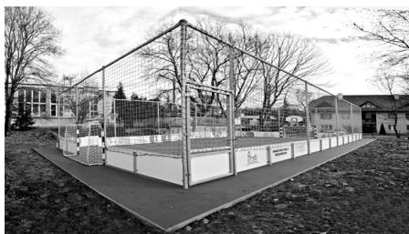
Óvodai futópálya, sportudvar