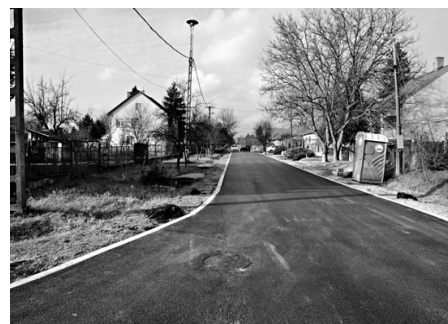
Új aszfaltburkolat a Mező utcában