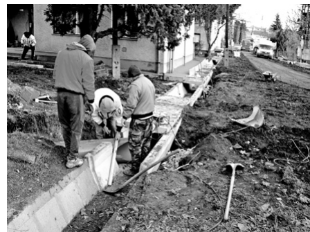
Orgona köz vízvezetés az Iskola tértől a Mikszáth utcáig