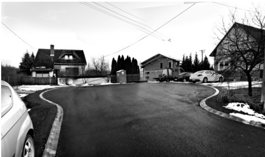
Rózsavölgy utcai útjavítás, és autóforduló