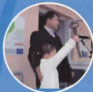
Általános iskola felújítása