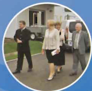
Ipari Park: Munkahely teremtés