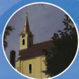
Katolikus templom felújítása