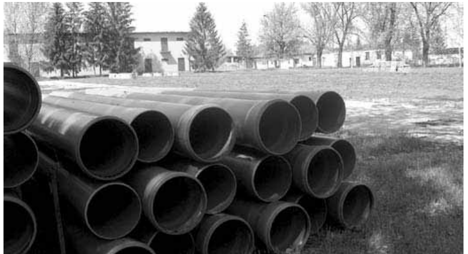
Az egykori alakulótéren még csak a készülődés nyomai látszanak