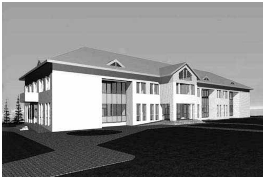
A járóbeteg központ látványterve

Mintegy tíz-tizenegy hónap alatt készül el maga az épület, majd ezt követően kell berendezni az orvostechnológiával. A épület tehát jövő év május végé, június táján lehet készen, s ezt követően augusztusra tehetjük a várható beüzemelését, s az átadást.