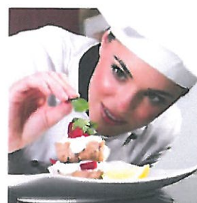
Étkeztetés és Konyha

A könyvelés támogatási szolgáltatást új cégünk, a Fortellum Kft. végzi a korábban már bizonyított vezetői, fejlesztői és támogatói szakember gárdával, az E-Szoftverfejlesztő Kft. maximális támogatásával és garanciájával.