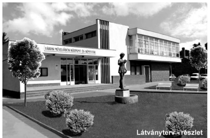
Látványterv - részlet