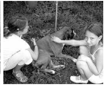
A rétsági lányok tordasi kutyával ismerkednek