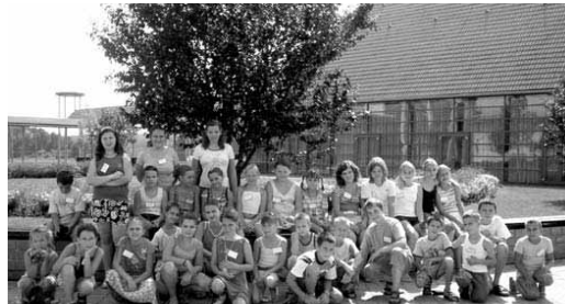
Kis csapatunk egyik ebéd után kamera elé állt